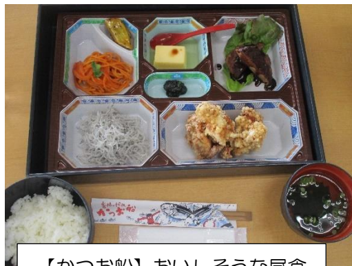
【かつお船】おいしそうな昼食

2日目の午前中に行きました。水不足になると、全国版のニュースでも流される有名なダムですが、実際に見て、その深刻さに衝撃を受けたようです。香川県の人にとっても「命の水」である早明浦ダムの水。香川県の人が、現在の水位を見に来ていたとのことでした。