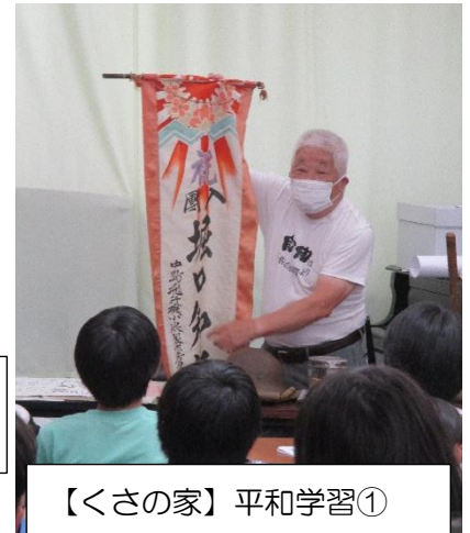
【くさの家】平和学習①