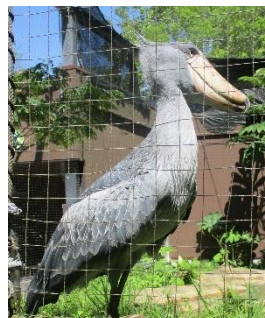
【高知県立のいち動物園】 ハシビロコウだ！！