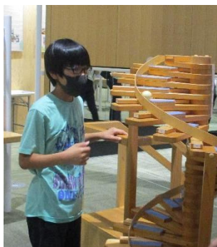
【オーテピア高知みらい科学館】プラネタリウムも見ました。